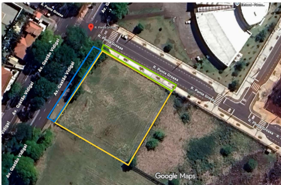
Figura 1. Local de execução dos serviços.